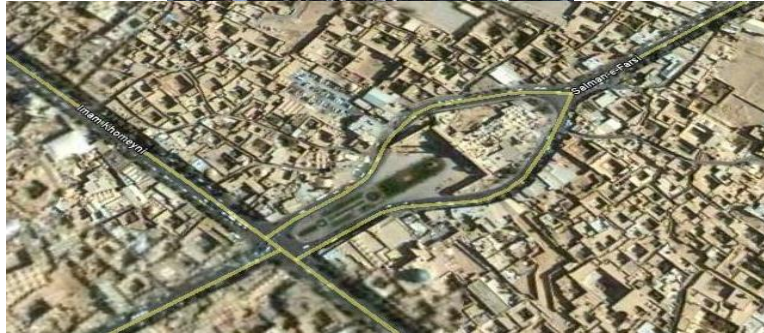
تصویر شماره ۱: میدان امیر چخماق یزد

نخل برداری شاید یک جور مراسم ماتم باشد و نخل نمادی از تابوتی که باید می بود تا پیکر پاکی را در روز عاشورا حمل کند و یا کنایه از علمی است که می باید در بین لشکر حمل می شد. ظهر عاشورا بعد از نماز پیرمرد جا افتاده ای از سادات بر روی نخل می ایستد و با شال گردن سبزی جوانان زیر نخل را هدایت می کند و شخصی هم بر بالاترین نقطه نخل رفته و با ضرب سنج حرکت و توقف نخل را کنترل می کند تا در آن شلوغی و شیون حرکت این نخل چند تنی به کسی آسیب نزنند.