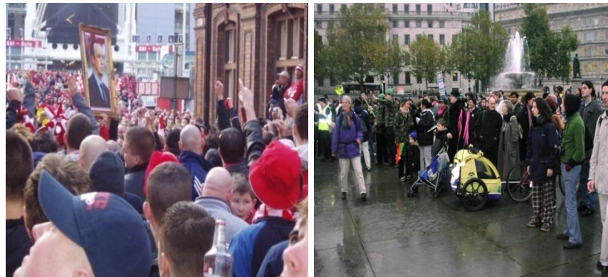
تصویر شماره ۳: میدان ترافالگار - لندن - انگلستان