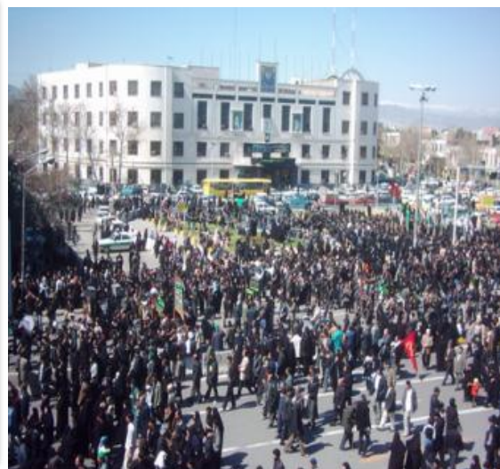
تصویر شماره ۲: میدان شهدا - مشهد